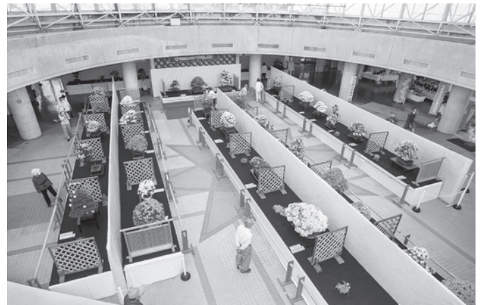
さつきの展示・品評会が行われるローズハット