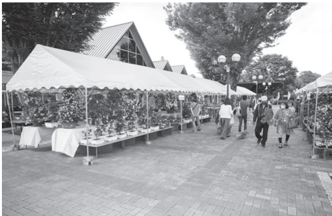
さつき等の販売所