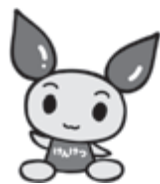
▲献血キャラクター「けんけつちゃん」