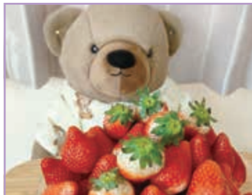
いちご大好き！ ぽぽち