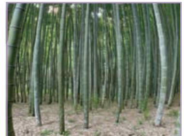
宇都宮の「涼」を探して イヌワシ