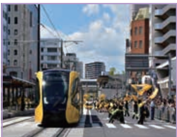
あれからもう1年 1周年祝い隊