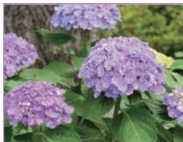
わたしの1番好きな花 あめちゃん