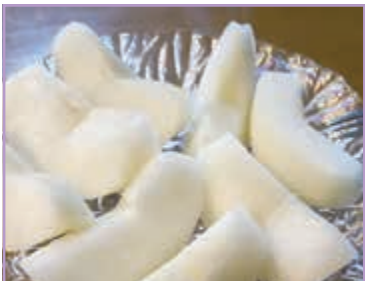
宇都宮の梨は日本一！ ライラック