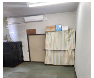
取り付けたエアコン