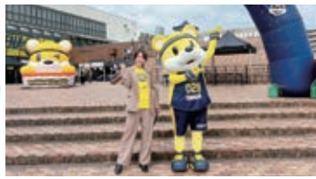
3 ブレックスアリーナ宇都宮