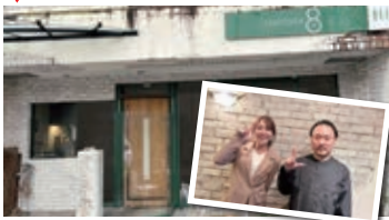
2 TRATTORIA otto