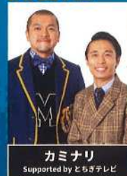
カミナリ Supported by とちぎテレビ