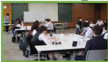
出前講座当日の様子📷