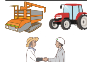
農業用機械のリース費