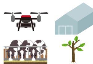
機械・施設、家畜、苗木等の購入費