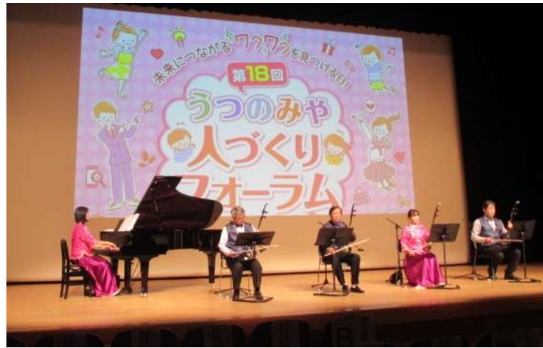
●ステージパフォーマンス