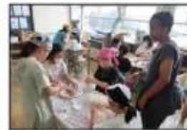
ALTと英語でコミュニケーション