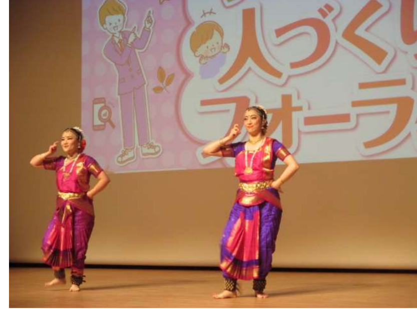
南インド古典舞踊バラタナティヤム (ガウリ&マリーチ)