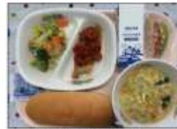
トマトを使った地域地産メニュー