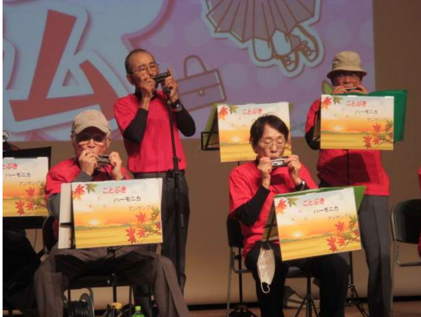
ハーモニカ演奏 (ことぶきハーモニカ・アンサンブル)