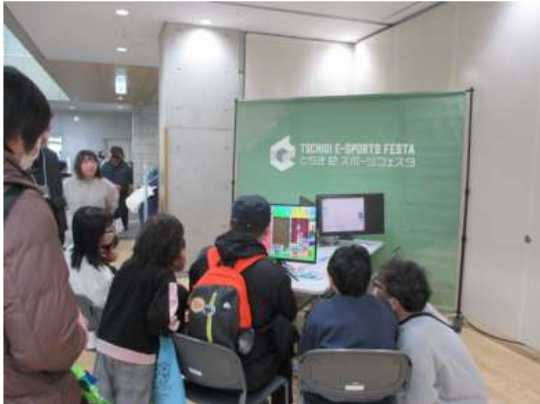
プログラミング体験