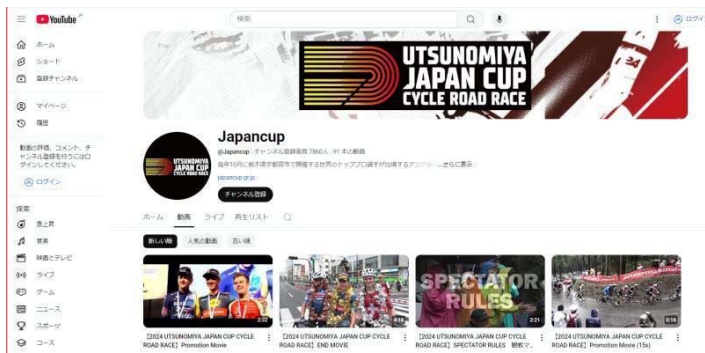
Youtube アカウントへの動画投稿

プロスポーツや多様なメディアを活用した情報発信や宮サイクルステーションの情報発信機能の強化、自転車マップの配布などにより、「自転車のまち宇都宮」のPRを行いました。その結果、「自転車のまち」の認知度に関しては、安定した推移ではないものの、目標値を超える年度もあり、概ね目標を達成できています。