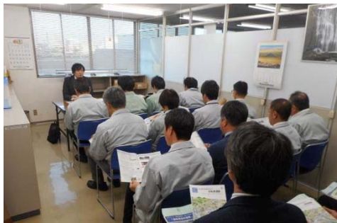
出前講座「自転車通勤のススメ」

災害時における自転車活用について、被災時の自転車などによる職員の参集を位置づけ、研修などを活用して周知しました。