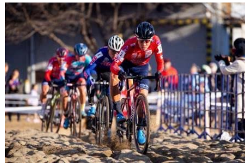
シクロクロスの開催（R5、R6、R7 宇都宮開催）