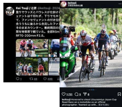
大会フォトグラファーと連携した SNS を活用した情報発信