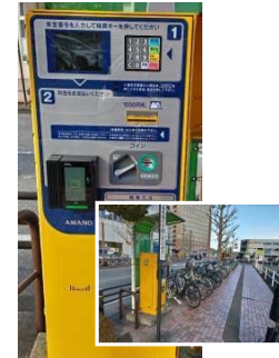
市営駐輪場の キャッシュレス決済機導入

ライトライン停留場付近の駐輪場については、本市内の停留所 15 か所のうち JR 宇都宮駅駐輪場の利用圏域内にある 2 か所（宿郷停留場、駅東公園前停留場）を除く 13 か所すべての停留場付近に駐輪場を整備したことで、利用者が順調に伸びています。一方で、利用率が高く混雑している駐輪もあり、対策が必要となっています。