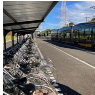
ライトライン駐輪場 〈清原 TC 駐輪場〉

自転車と公共交通が連携した利便性の高い移動環境を形成するため、鉄道駅やライトライン停留場、バス停留所周辺において駐輪場の整備を進めるとともに、市営駐輪場へのキャッシュレス決済導入などの利便性向上に取り組んだことで、市営駐輪場及びライトライン駐輪場の利用者数はコロナ禍の減少から回復傾向にあります。