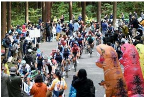
宇都宮ジャパンカップ（ロードレース）

また、栃木県や関係市町、Astemo 宇都宮ブリッツェンなどが連携し県内に設定した4つのサイクリングモデルルートのうち、「おにハチ」及び「ルート NIKKO」に参画し、環境整備を実施しました。その他、市内観光地などにおける自転車での周遊促進、サイクリングルート沿線の休憩スポットや宮サイクルステーションの充実など、サイクリストへの支援を通じて、サイクルツーリズムを推進しました。