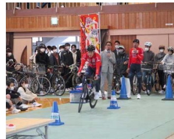
〈ブリッツェンと連携〉