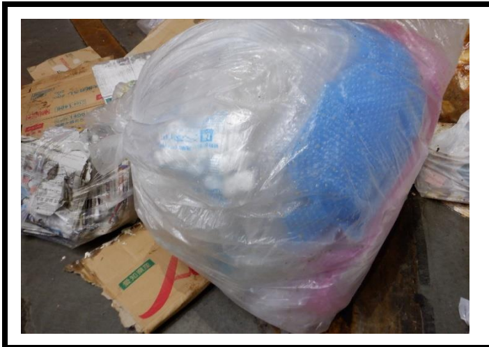
搬入不適物 (廃プラ/梱包材)