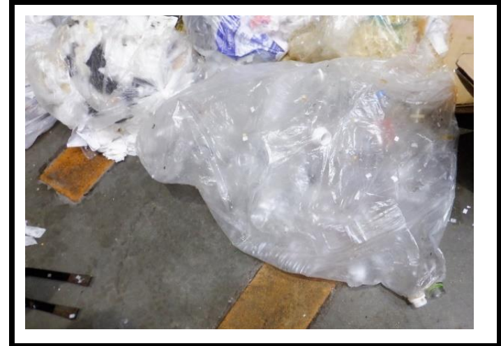
搬入不適物 (資源物/ペットボトル)