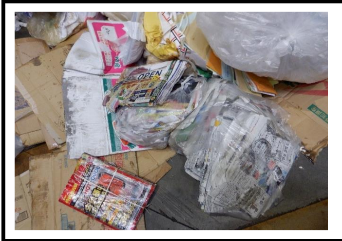
搬入不適物 (資源物/紙類)