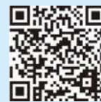
県税のホームページ

(県税のホームページについてのお問い合わせは県庁税務課まで ☎ 028-623-2101)