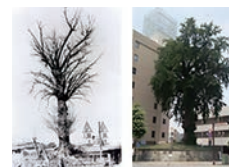
▲左は空襲直後、右は現在の「大いちょう」

空襲で、旭町の「大いちょう」は黒くすすけ、枯れてしまったと思われましたが、翌年には葉を茂らせた「大いちょう」は宇都宮の復興のシンボルとなり、今でも市民に親しまれています。